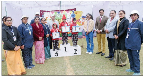
भिवानी। प्रतिभागियों को सम्मानित करते हुए।

प्रतिमा पर माल्यार्पण एवं दीप प्रज्वलित करके किया गया। सर्वप्रथम विद्यालय परिसर में राष्ट्रीय ध्वज फहराया गया तथा मुख्य अतिथियों की उपस्थिति में सभी प्रतिभागियों ने खेल को खेल की