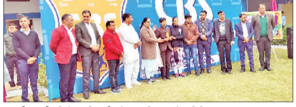
चरखी दादरी। विजेता प्रतिभागी को सम्मानित करते अतिथि।