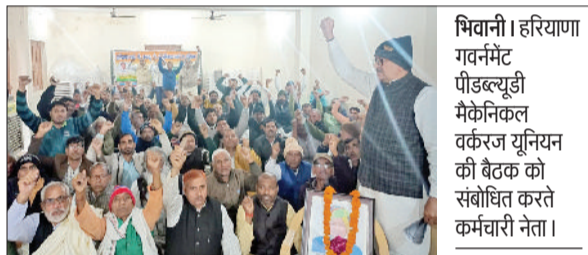
भिवानी। हरियाणा गवर्नमेंट पीडब्ल्यूडी मैकेनिकल वर्करज यूनिन की बैठक को संबोधित करते कर्मचारी नेता।

भावना से खेलने की शपथ ग्रहण की। इसके बाद मार्चपास्ट किया गया। विद्यालय की कक्षा चौथी से आठवीं के विद्यार्थियों द्वारा पीटी, डम्बल, लेजियम एवं योगा का आकर्षक प्रदर्शन किया गया।