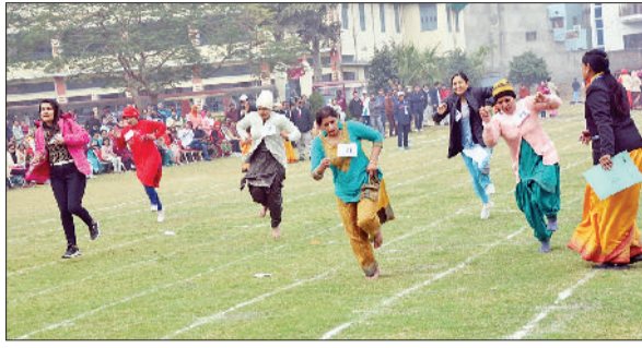
भिवानी। प्रतियोगिता में एक टांग की दौड़ में भाग लेती शिक्षिका।