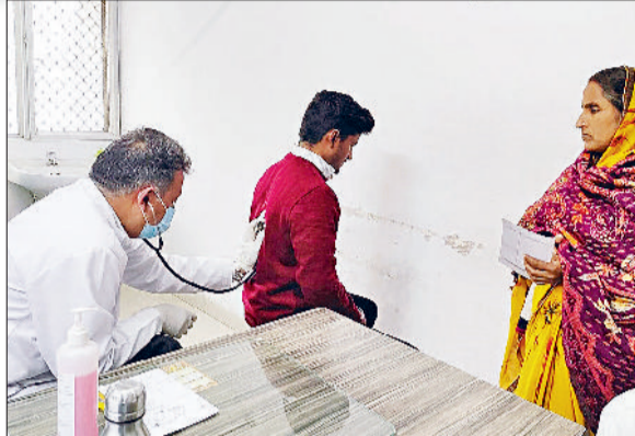
हरिभूमि न्यूज ▶▶ भिवानी

शनिवार को भी सामान्य अस्पताल के चिकित्सक हड़ताल पर रहे। इस दौरान कुछ चिकित्सक तो ड्यूटी पर आए, लेकिन कुछ हड़ताल पर रहे