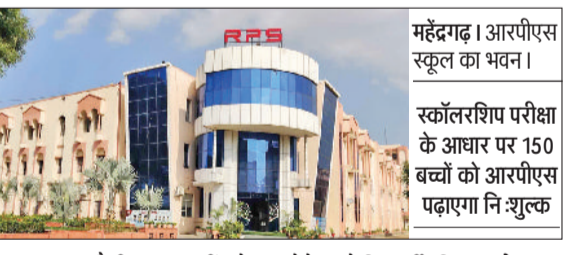
महेंद्रगढ़। आरपीएस स्कूल का भवन। स्कॉलरशिप परीक्षा के आधार पर 150 बच्चों को आरपीएस पढ़ाएगा निःशुल्क

आरपीएस विद्यालय में 31 दिसंबर को आयोजित स्कॉलरशिप परीक्षा का आयोजन किया जाएगा। इस परीक्षा के लिए आरपीएस ग्रुप के सभी 17 विद्यालयों में परीक्षा केंद्र सभ्य, विद्यार्थी अपनी सुविधा अनुसार संबंधित परीक्षा केंद्र पर पहुंचकर परीक्षा दे सकते हैं। परीक्षा में कक्षा तीसरी से 11वीं तक के बच्चे भाग ले सकेंगे। परीक्षा के आधार पर विद्यार्थियों को स्कॉलरशिप दी जाएगी तथा इस परीक्षा के आधार पर सुपर-30 के