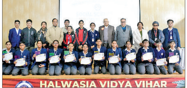
भिवानी। विजेताओं को पुरस्कृत करते अतिथि।

लिए कक्षा नौवीं व 11वीं के मॉडकल, नॉन मॉडकल, कॉमर्स तथा आर्ट के चयनित विद्यार्थियों का फाइनल राउंड भी होगा, जिस आधार पर उन्हें विद्यालय में पूरी तरह से निःशुल्क शिक्षा प्राप्त करने का अवसर मिलेगा। परीक्षा में भाग लेने वाले विद्यार्थी रविवार को सुबह 9:30 बजे तक पहुंचकर अपना पंजीकरण अवश्य करवा लें। परीक्षा देने के लिए आने वाले परीक्षार्थी अपने स्कूल का आई कार्ड व आधार कार्ड भी साथ लेकर आएँ। आरपीएस ग्रुप की चेरयरसन डॉ.